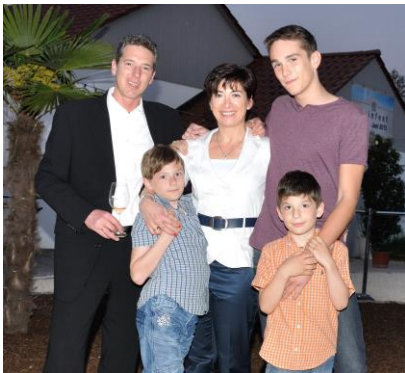
Die 3. und 4. Generation