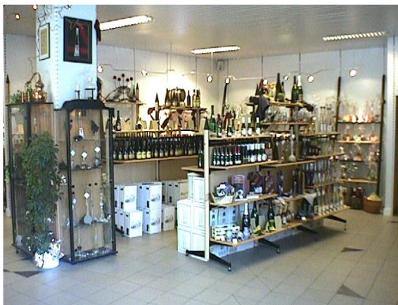
Verkaufs- und Präsentationsraum

Gerne organisieren wir für Gruppen von 20 bis 30 Personen individuelle Weinproben bei uns oder auch außer Haus.