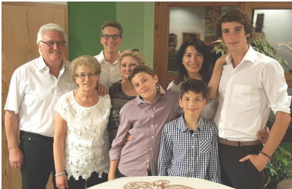
Die 3. und 4. Generation