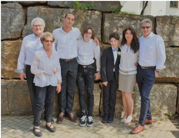
Die 2., 3. und 4. Generation