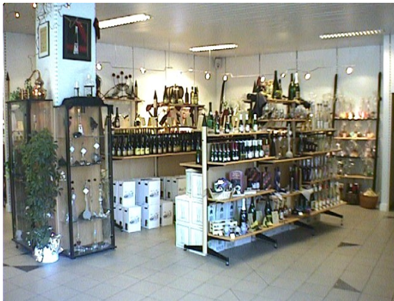
Verkaufs- und Präsentationsraum

Gerne organisieren wir für Gruppen von 20 bis 30 Personen individuelle Weinproben bei uns oder auch außer Haus.